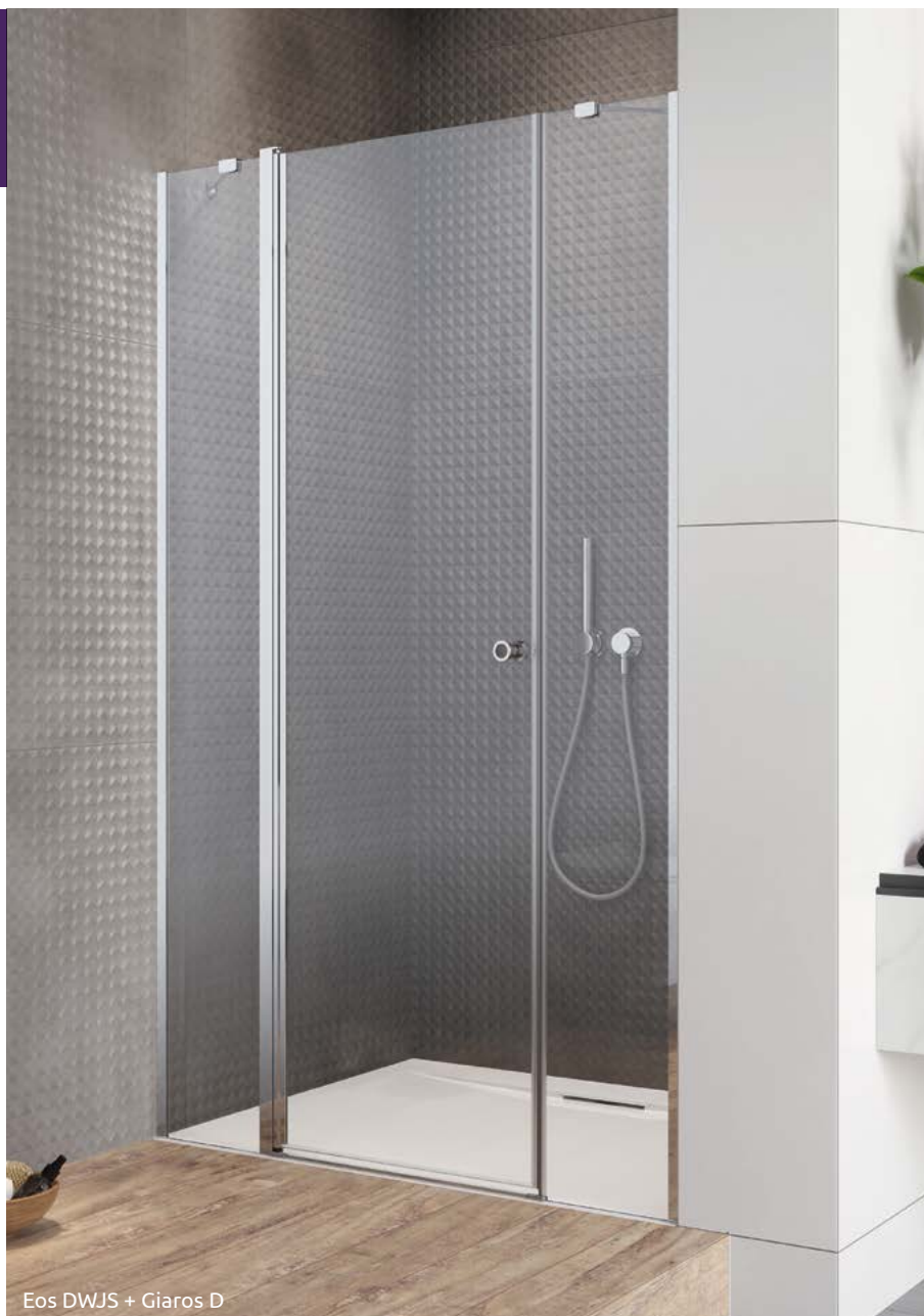
Eos DWJS + Giaros D