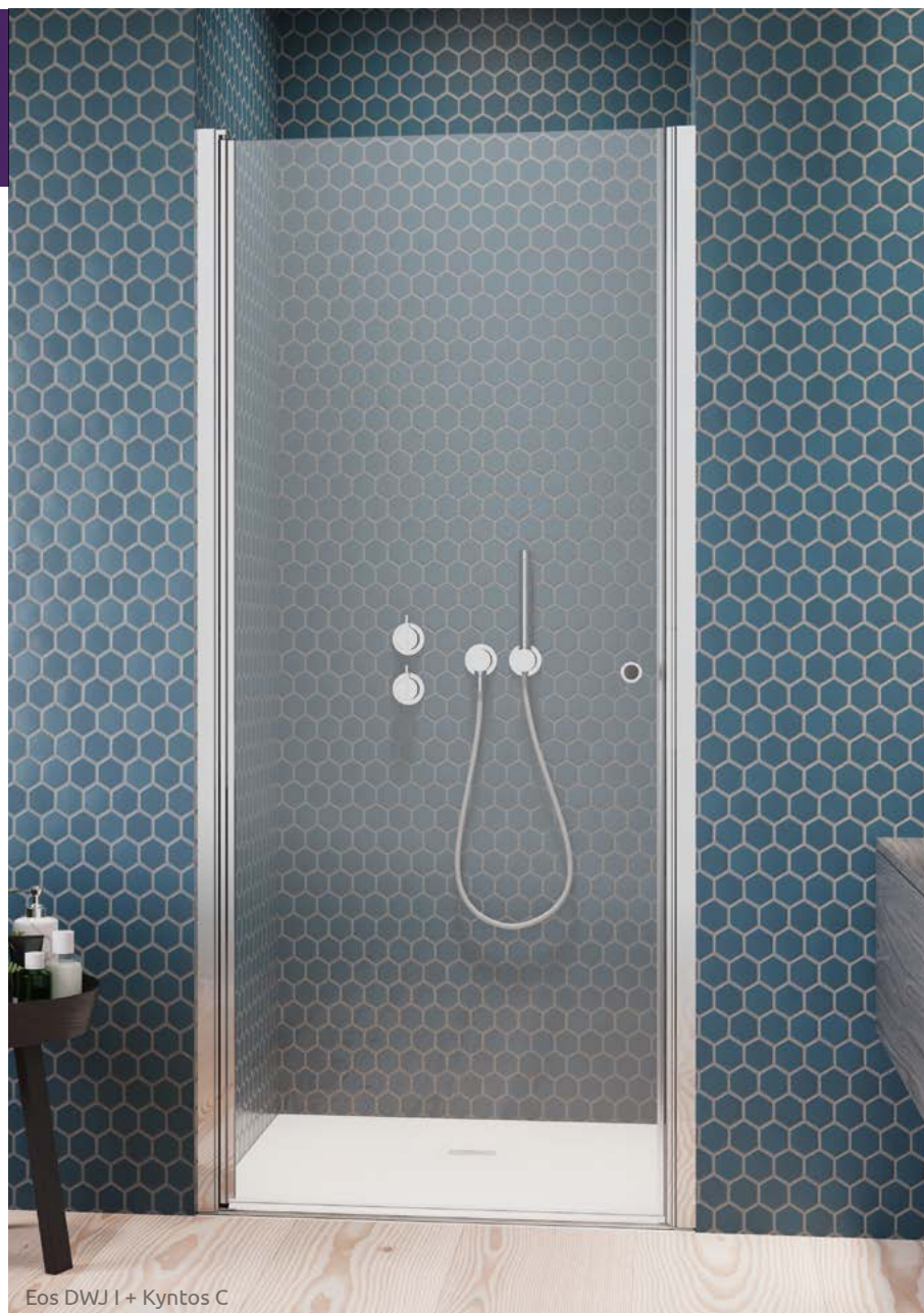
Eos DWJ I + Kyntos C