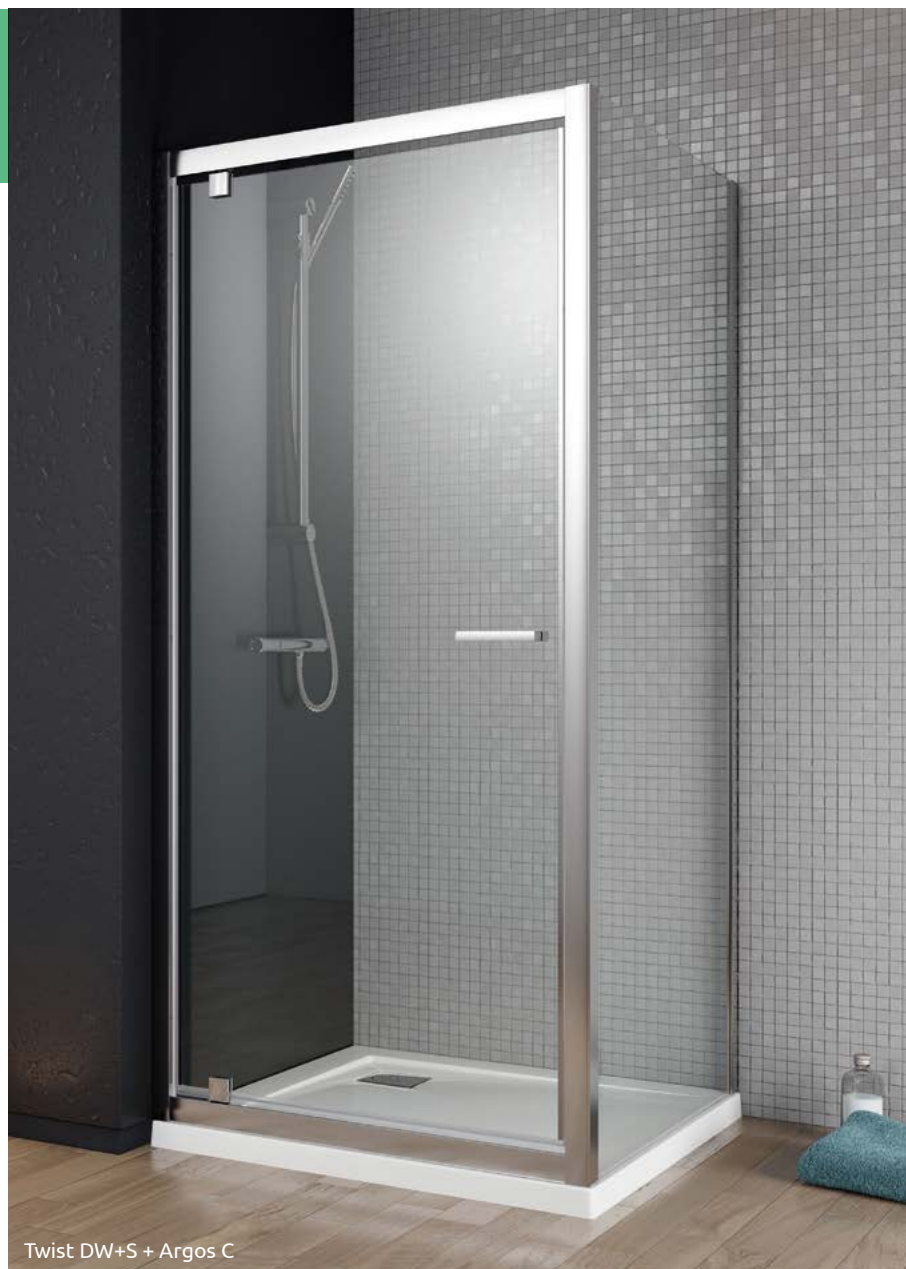
Twist DW+S + Argos C

Składając zamówienie, należy podać 2 numery artykułów: drzwi kabiny oraz ścianki bocznej. Drzwi uniwersalne, można je zamontować jako wersję lewą lub prawą.